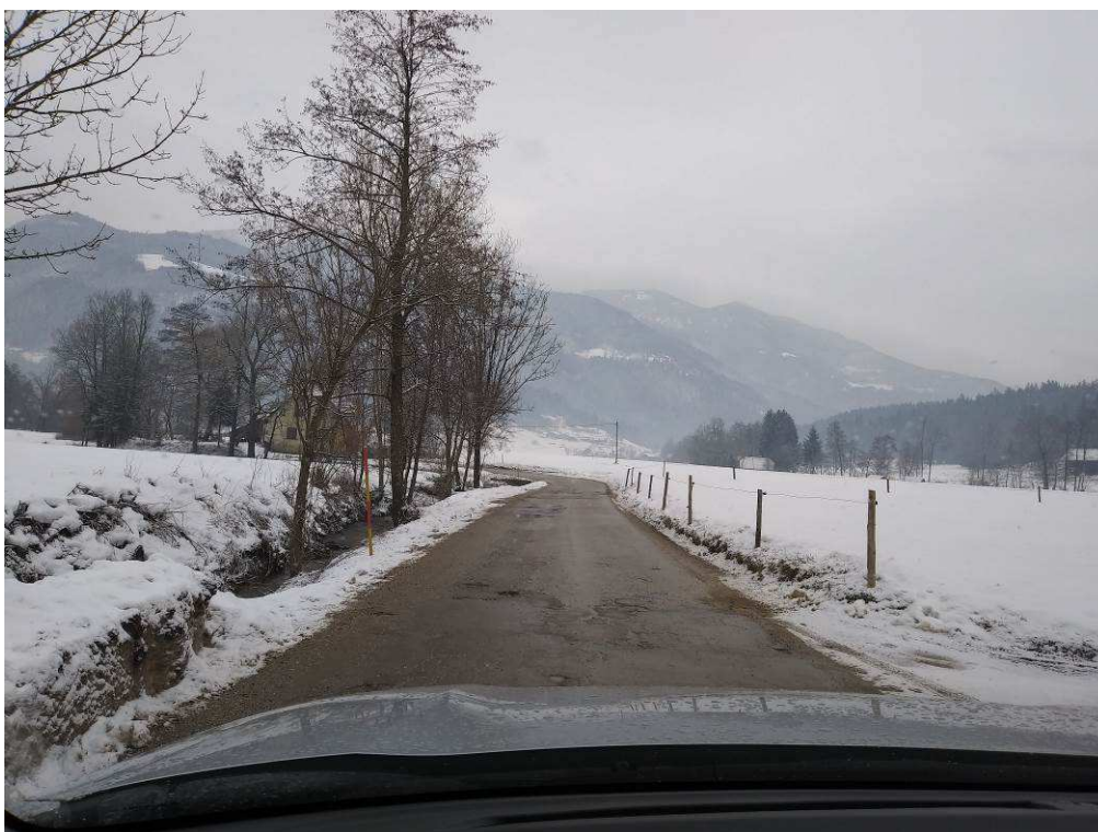
Slika 3: Pogled na traso