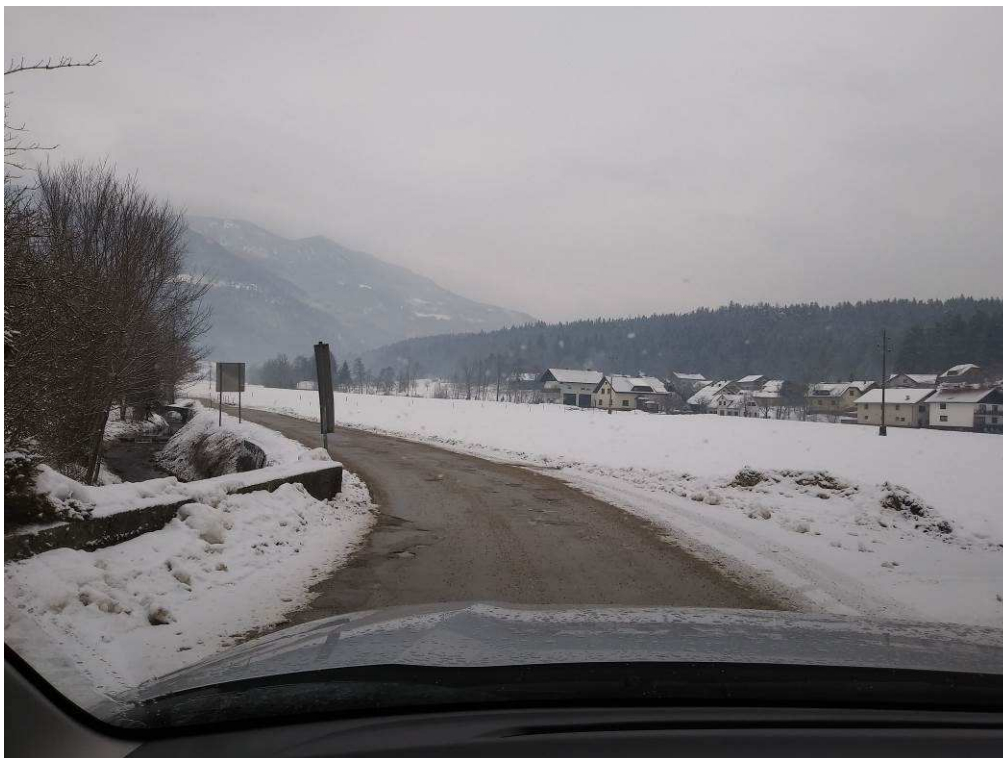
Slika 2: Začetek trase