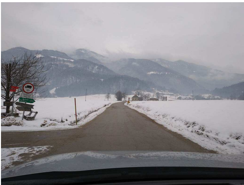
Slika 5: Konec trase