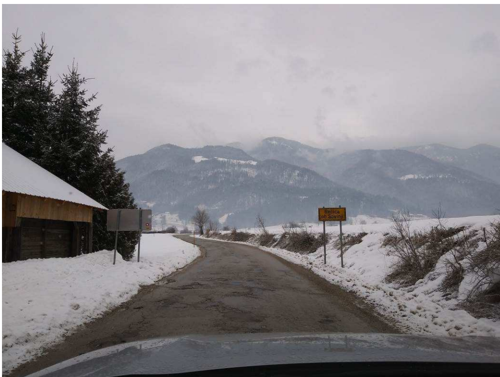
Slika 4: Pogled na traso