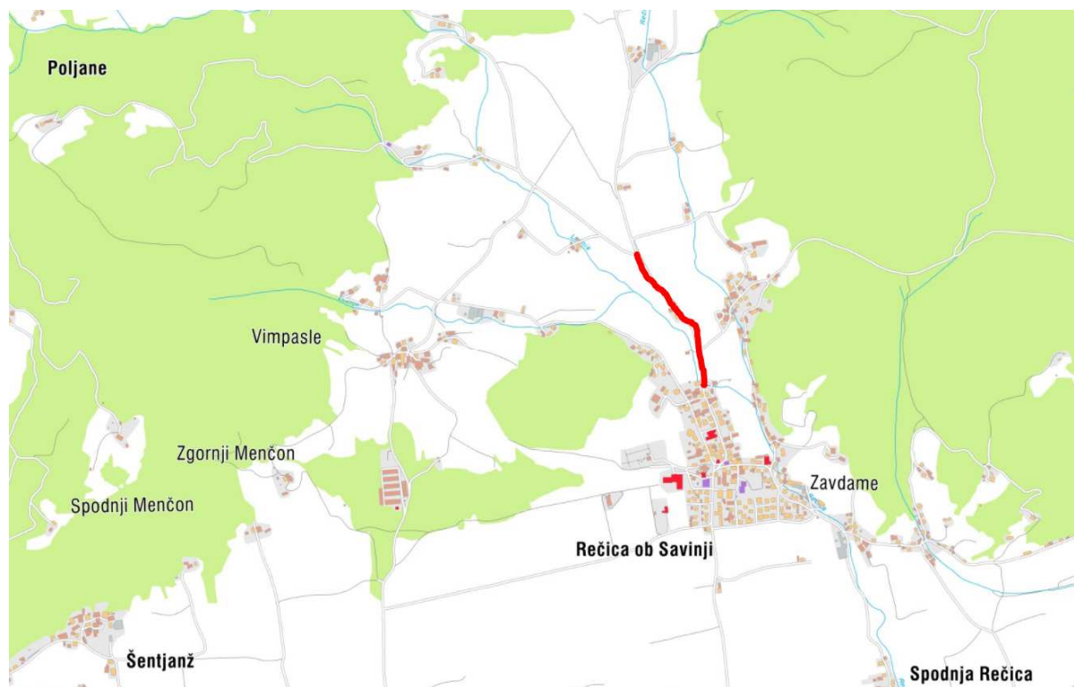
Slika 1: Lokacija odseka

Na osnovi naročila občine Rečica ob Savinji smo izdelali tehnično dokumentacijo za javni razpis rekonstrukcije lokalne ceste LC 267-063 v skupni dolžini 490,00m.